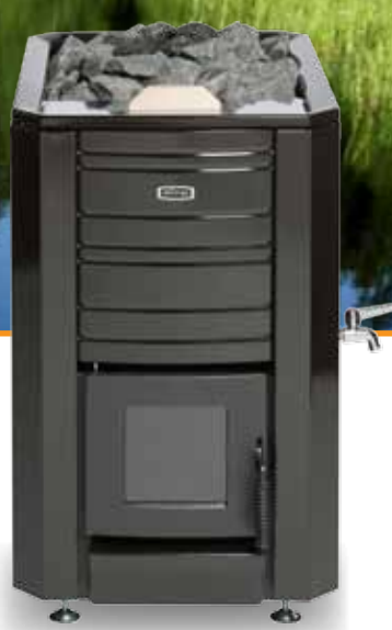
Aito 24 VS