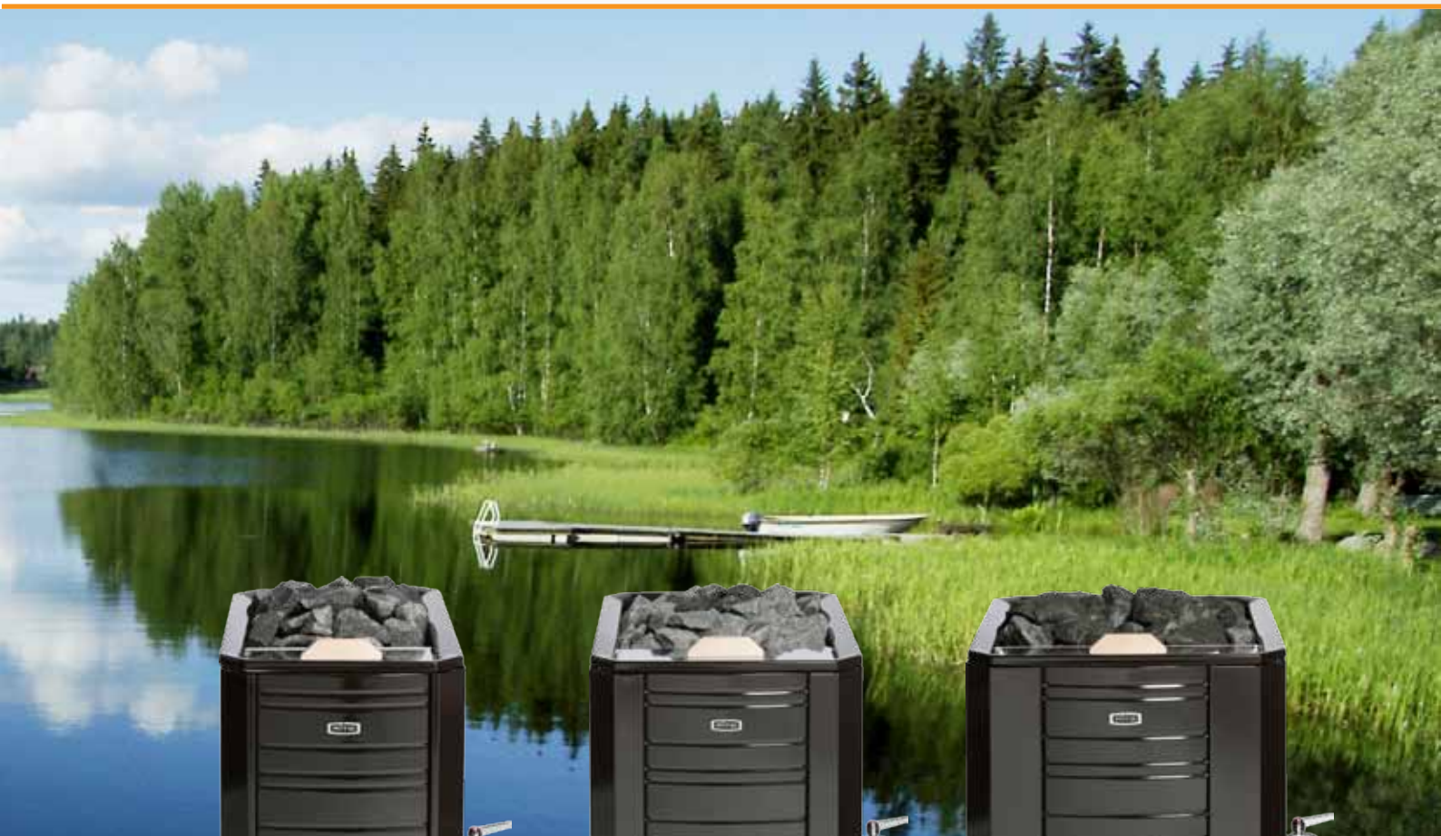
Aito 16 VS