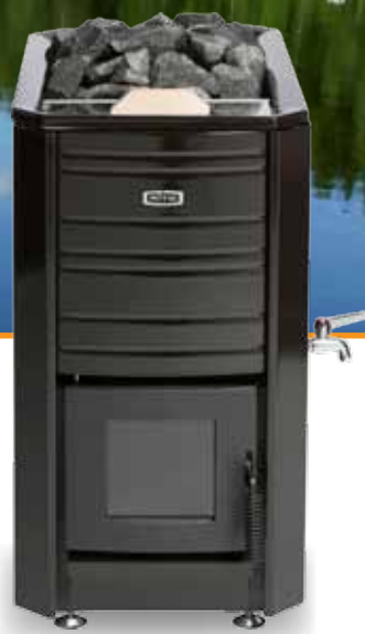
Aito 20 VS